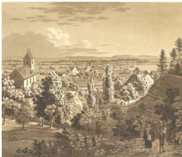
Neujahrsblatt der Stadtbibliothek Winterthur, 1823 (Zentralbibliothek Zürich)