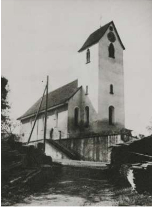
Kirche Flaach 1930 Fotografie aus der Zwischenkriegszeit