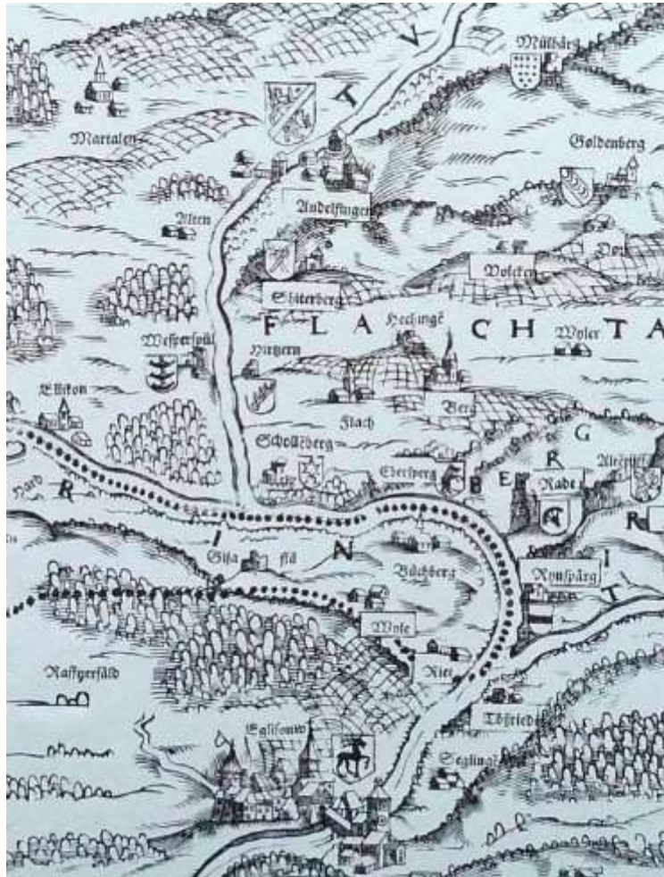
Murer-Karte, in der Mitte liegt Flaach; um 1560