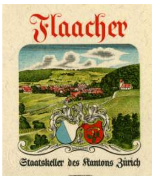
Weinetikette der Staatskellerei (Winterthurer Bibliotheken, Studienbibliothek)