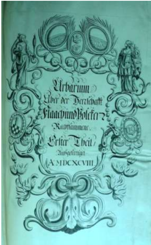
Urbar der Herrschaft Flaach-Volken von 1698 (Staatsarchiv des Kantons Zürich F II a)