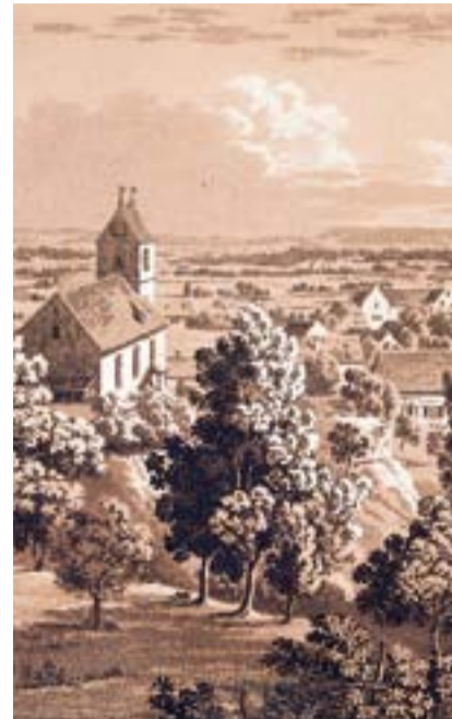
Historische Darstellung der Kirche Flaach von 1823. Rechts oben ist der Treppengiebel des Schlosses zu sehen.